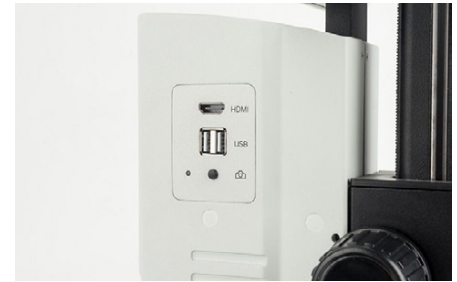
OIV 254 Boto de instantánea