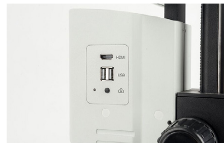
OIV 254 Pulsante Snapshot