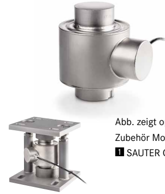
Abb. zeigt optionales Zubehör Montagekit ■ SAUTER CE P41430