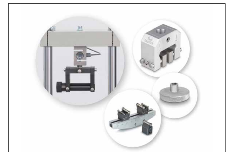
Possibilités de fixation solides et flexibles de nombreux accessoires et pinces de la gamme SAUTER, voir Accessoires